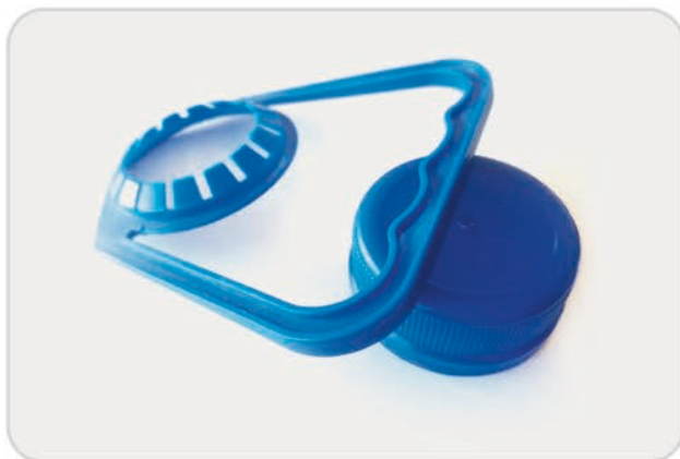
درب و دستگیره 28-30 | Cap and Handle 28-30